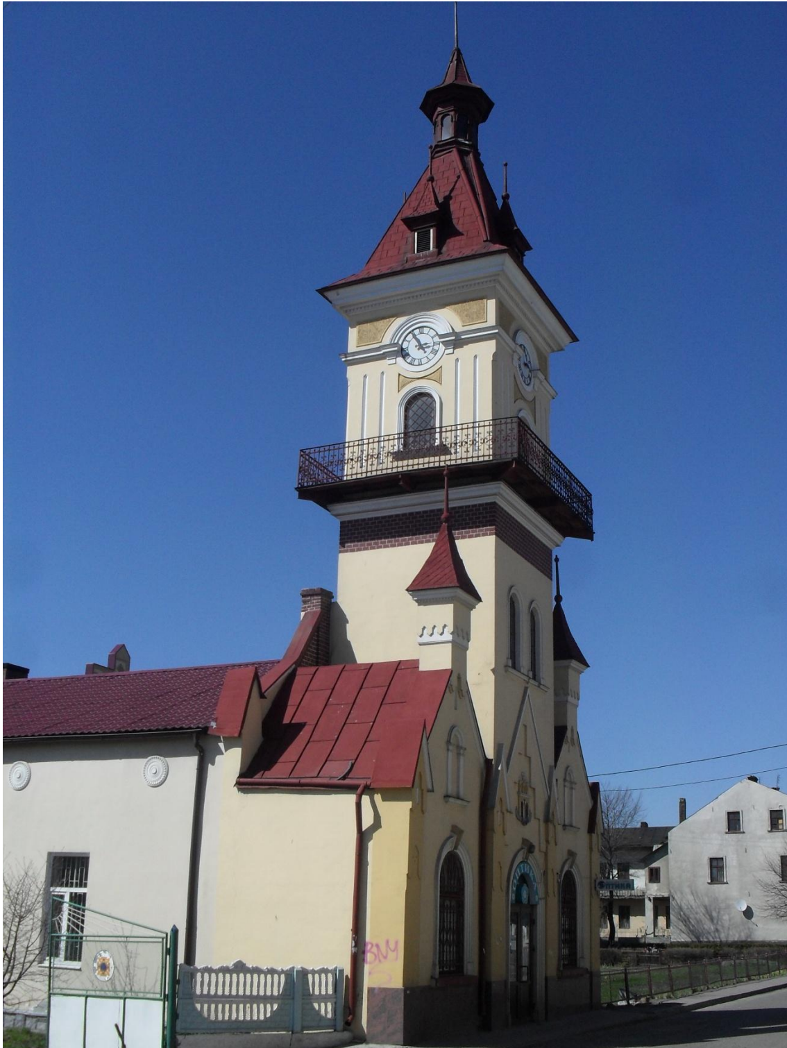
Пожежна вежа з годинником. Сучасний вигляд

В кінці 80-х років чисельність протипожежної дружини становила від 14 до 24 осіб в основному з числа ремісників.