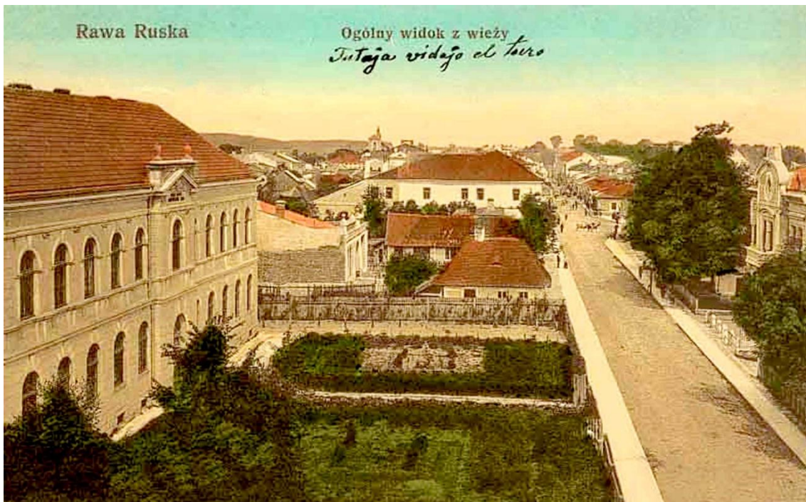
Поштова листівка. Фото з пожежної вежі.

29 червня 1887 року в Раві-Руській випав град величиною в гусяче яйце. Деякі куски льоду важили близько півкілограма.