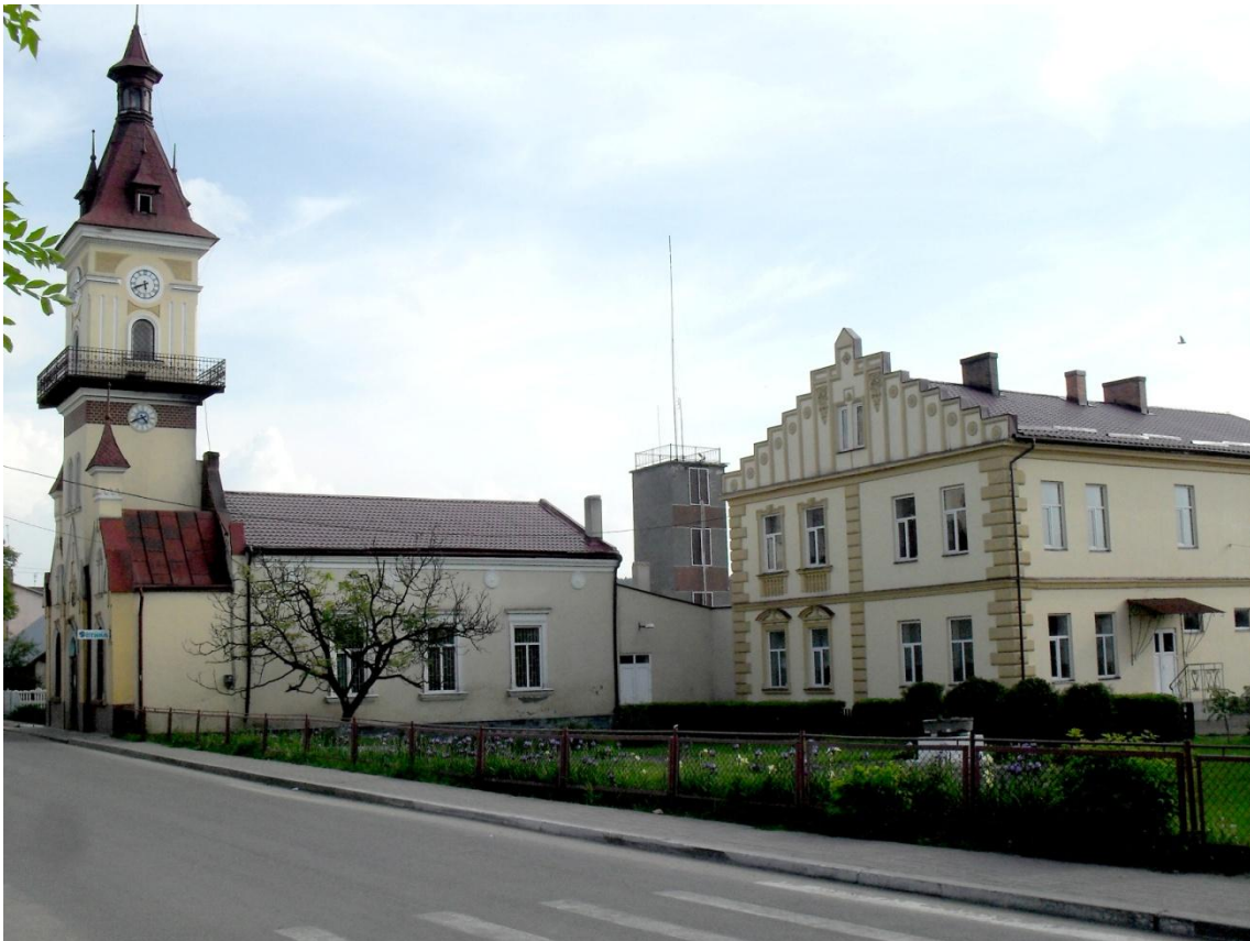
Сучасний вигляд пожежної вежі з годинником.

За часів Австро-Угорської імперії питання протипожежного захисту стало національною справою. В рамках таких організацій як “Просвіта”, “Сокіл”, “Луг”, “Січ” фах пожежника постійно проходив процес удосконалення.