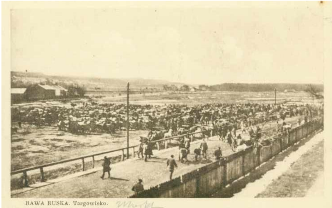
Торговиця на околиці міста

в історії, як остготи, слов'янські племена, які пізніше утворили князівство Тмутаракань в районі Кубані, йшли, гнані наступаючими холодами, через наше місто, вірніше місцевість. Другого шляху в племен, які попадали з правого берега річки Вісли і йшли в напрямку Любліна просто не було. Кругом були не прохідні болота, як з заходу від Рави-Руської, одні назви чого вартують Мочари, Сігли, так і сходу. Циклічне потепління VII-XII століття, коли кліматичні умови і розвиток технічних можливостей (збільшення знарядь з заліза), сприяло збільшенню кількості населення в наших краях, сприяло появі міста Потелич і, власне в X столітті, виникає поселення Рата. Основним заняттям, населення було перетягування возів через річку Рата. В цей час це місце займало стратегічне значення, бо по ньому везли сіль з району Дрогобича в напрямку Любліна і Белза.