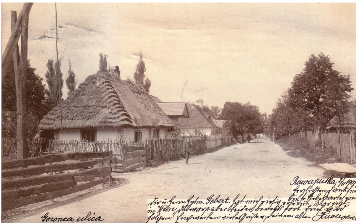
Вулиця О.Пушкіна в Раві-Руській. Фото XVIIIст.

Привілей короля Казимира Ягеллончика про надання Хелмінського права (1462 рік)