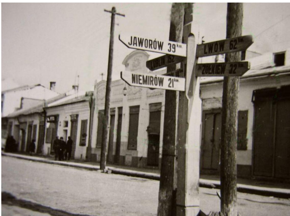
Приринкова забудова (східна сторона). Інформаційний вказівник.

Декілька слів про так зване "хелмське", або "хелмінське" право, яке широко застосовувалося у багатьох містах Правобережної України. За своєю суттю хелмське право — різновид міського права. Воно являло собою переробку