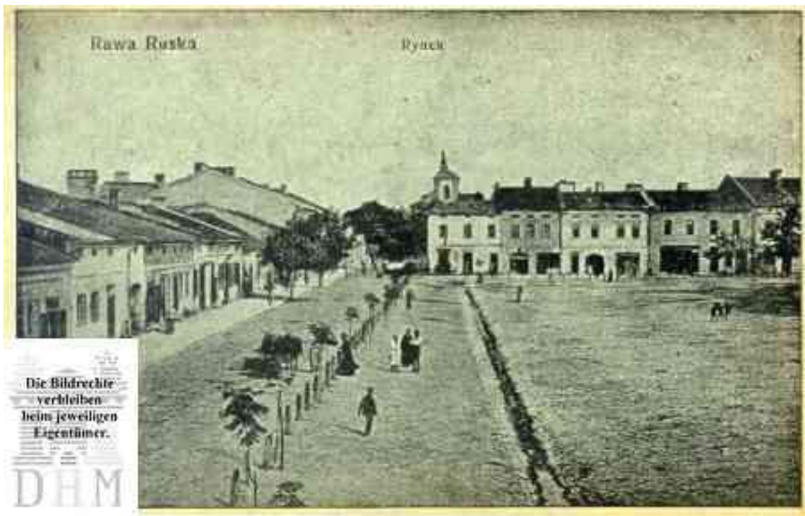
Приринкова забудова. Вигляд на костел св.Йосифа.