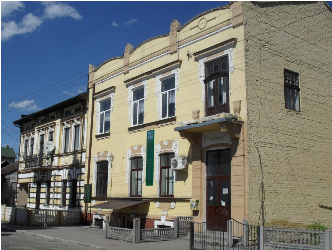
Будинки по вул. М.Грушевського

На переломі XIX-XX століть та в міжвоєнний період в Раві-Руській було побудовано ряд великих комплексів, громадські та житлові будинки, численні стилеві вілли. До наших часів збереглися декілька таких будівель, які внесені в реєстр пам'яток архітектури місцевого значення.