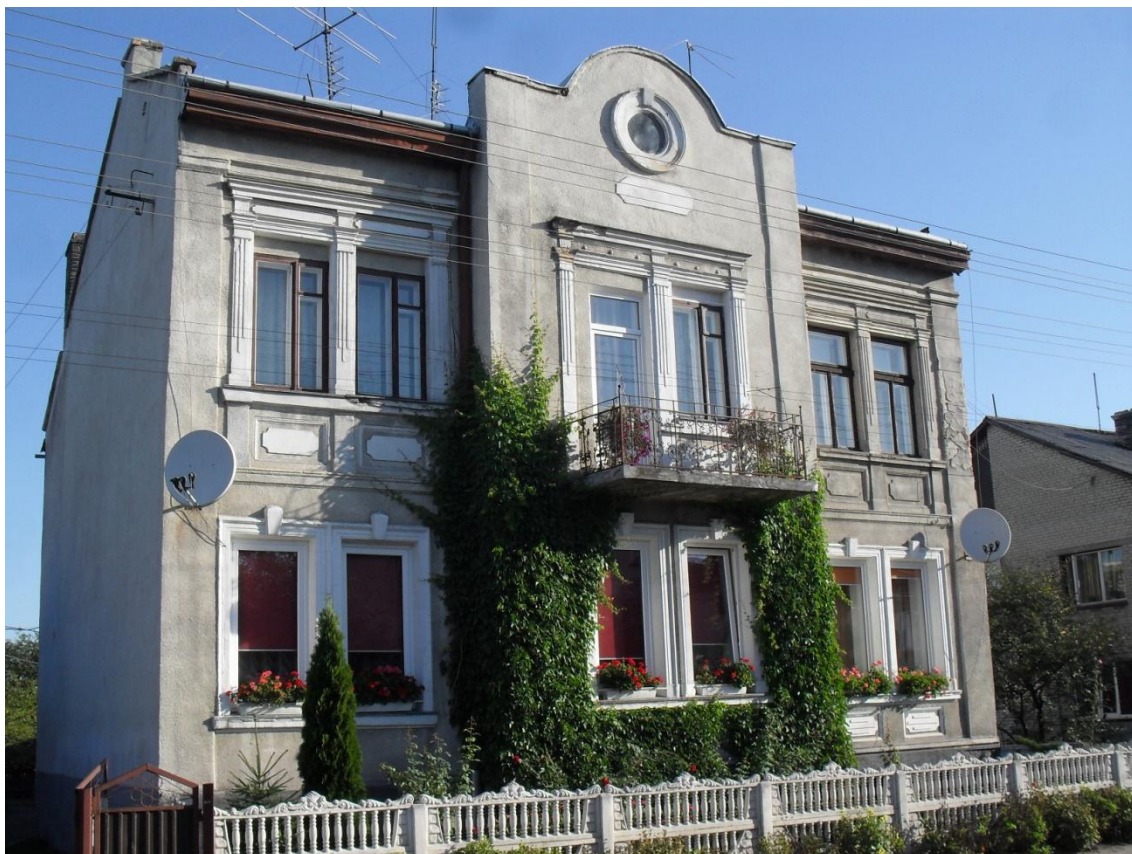
Житловий будинок по вул. Вокзальна