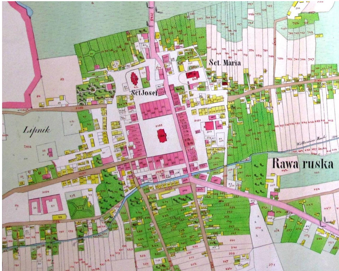
Кадастрова карта земель міста Рава-Руська. 1854 рік.

Характер забудови міста добре видно з кадастрової карти земель міста Рава-Руська виданої у 1854 році.