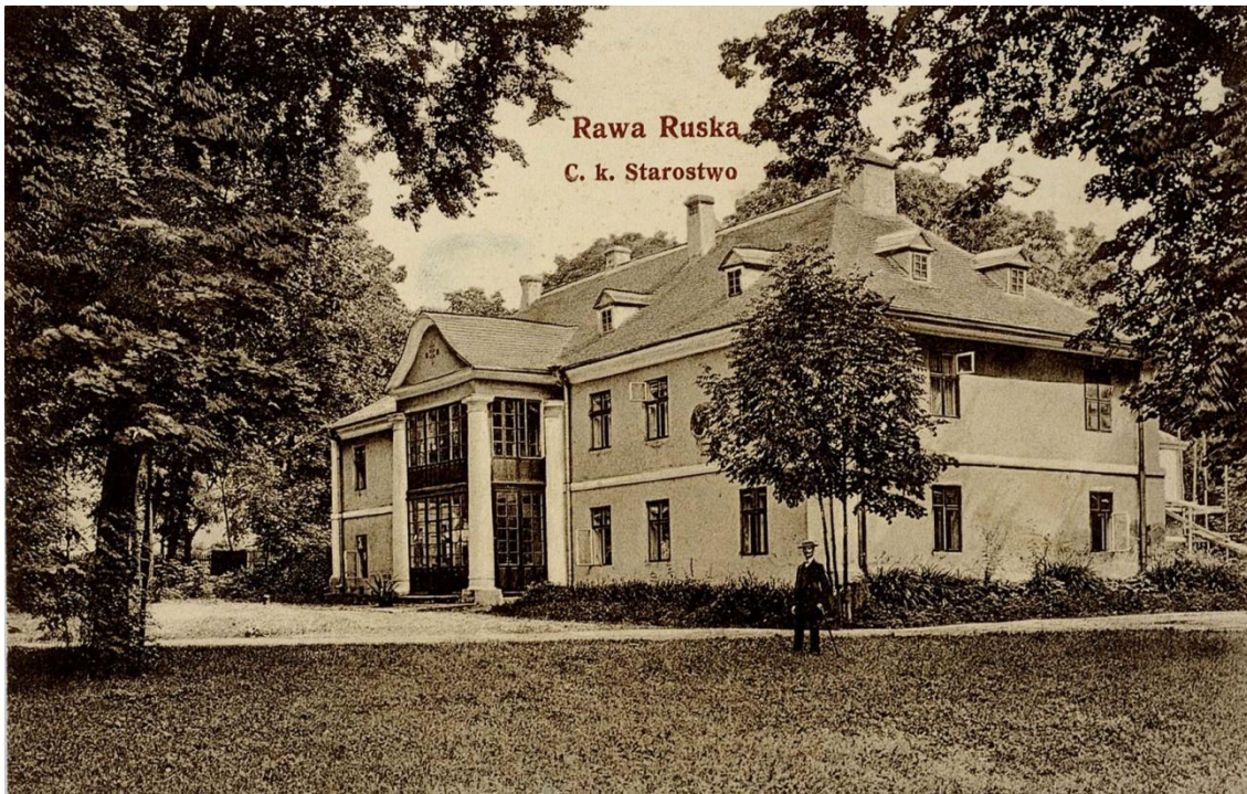
Будинок Рава-Руського староства. Фото 1915 року

Протягом всього періоду іноземної окупації західно-українських земель майже безперервно містом правили старости.